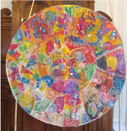
Foto: Mandala.